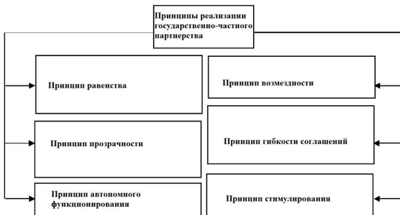
Рис. 1. Принципы реализации государственно-частного партнерства

Таким образом, совокупность принципов, на которых основано государственно-частное сотрудничество, графически можно отразить в виде схемы (рис. 1).