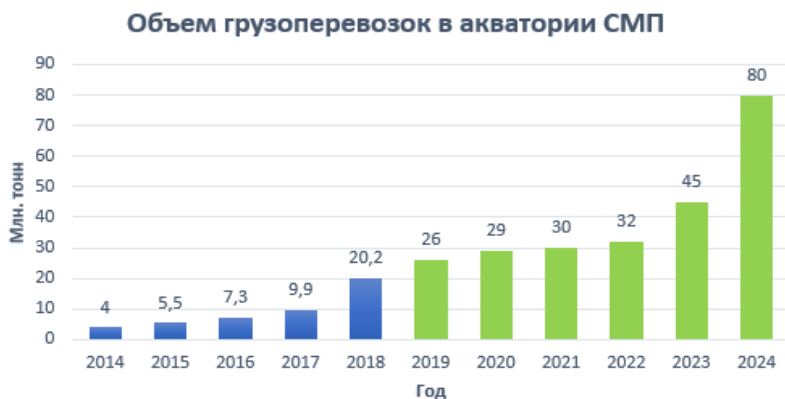
Рис. 2. Объем грузоперевозок в акватории СМП

по 2024 год. По плановым значениям показателя объема перевозок грузов в акватории СМП можно заметить, что наибольший прирост в значении данного показателя в сравнении с предыдущим годом запланирован на 2024 год. Прирост должен составить 77,8% или 35 млн тонн грузов за год [3,4].